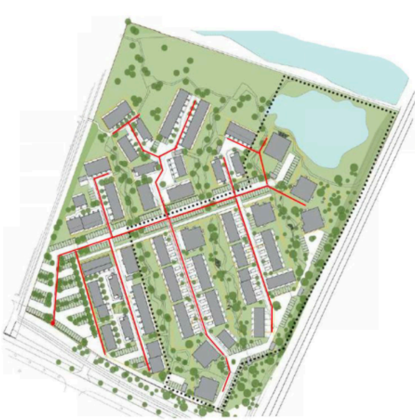
Figur 1. Forventet placering af fjernvarme- og stikledninger til Teglsøerne markeret med rød.