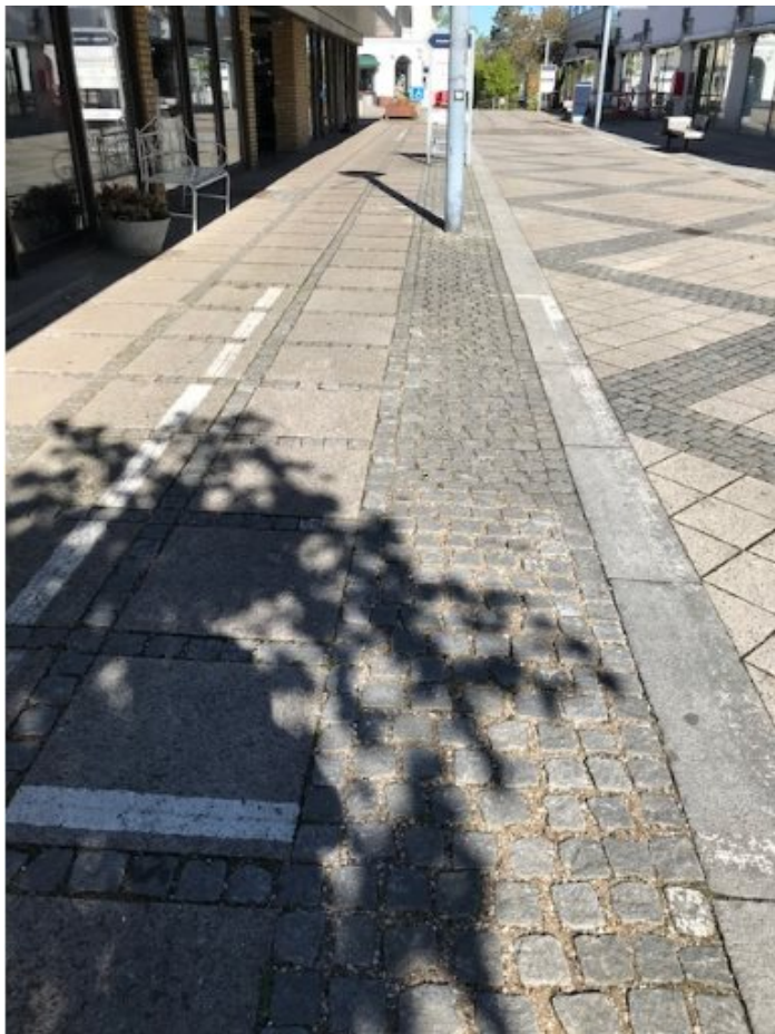
P-bås ud for butik i nr. 16 der ønskes fjernet

Fredensborg Kommune har modtaget henvendelse fra butiksindehaveren af Jernbanegade 16 i Fredensborg; vedr. ønske om at nedlægge en parkeringsbås som er placeret umiddelbart uden for butikkens vindue.