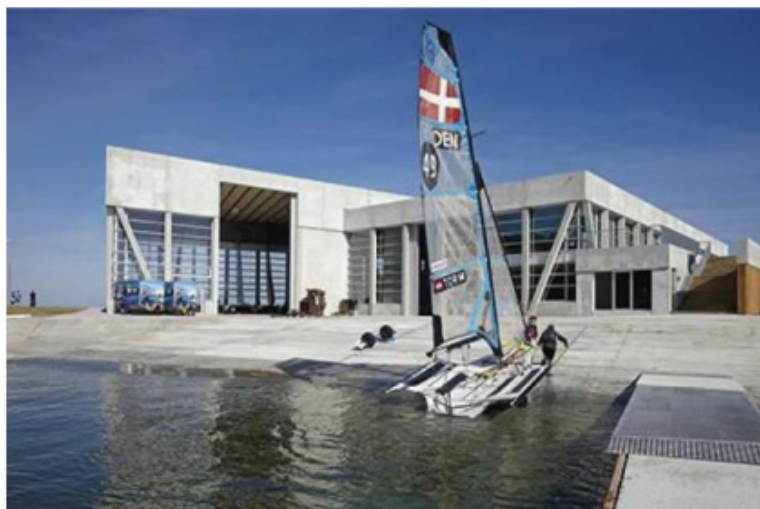
Referencefoto Århus ny sejlklub