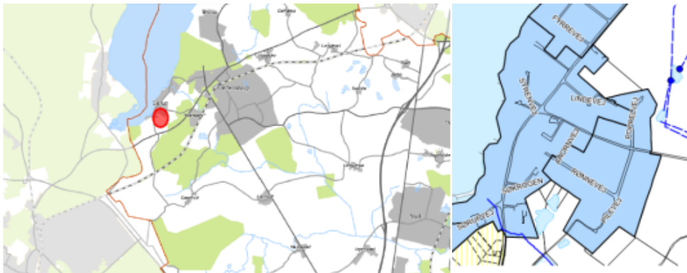
Figur 1 Oversigtskort Figur 2 Områdefgrænsning

Tillægget inddrager 2 søer, der er beliggende syd for Rønnevej i Sørup som spildevandstekniske anlæg i spildevandsplanen. Søerne har været optagede som spildevandstekniske anlæg fra 1975, da den første spildevandsplaner for Fredensborg-Humlebæk Kommune blev vedtaget og frem til 2011, hvor de ved en fejl blev fjernet fra spildevandsplanen, da spildevandsplanen blev revideret. Tillægget retter op på denne fejl og medfører ingen ændringer fysisk.