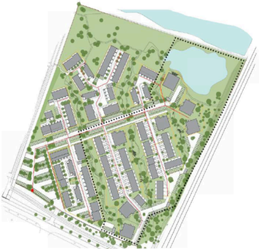
Figur 1. Forventet placering af fjernvarme- og stikledninger til Teglsøerne markeret med rød.