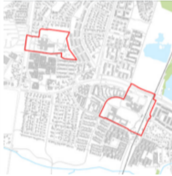
Kort med perspektivområdet