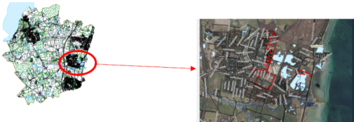
Figur 1 Tillæggets afgrænsning (rød) og placering i Nivå.

Tillæggets placering fremgår af figur 1: