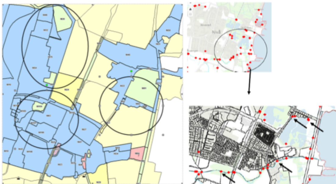
Figur 2 Placering af de 3 berørte kloakoplande før tillæggets vedtagelse. De blå og grønne områder er separatkloakerede oplande. De lyserøde er fælleskloakerede oplande, og de gule er spildevandskloakerede. På kortet nederst til højre er de berørte udløb markeret med røde prikker og sorte pile.

I forbindelse med klimasikringen af Nivå By nedlægges 4 kloakoplande helt, 4 kloakoplande reduceres i størrelse og der oprettes 2 nye kloakoplande, som omfatter de berørte områder. Det ene nye kloakopland omfatter Niverød Øst, og det andet omfatter Vibevej.