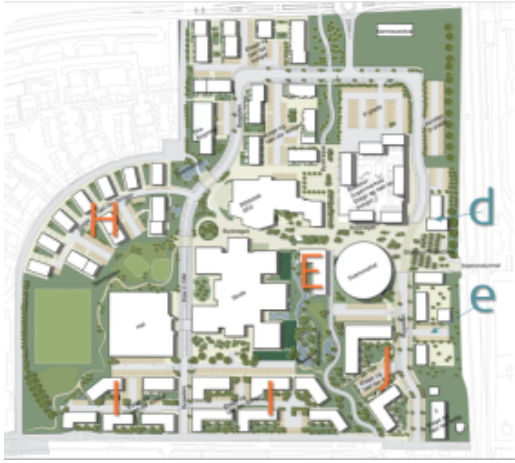
Kort med byggefelter i Nivå Bymidte