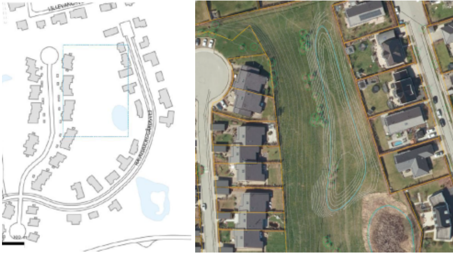
Figur 1 – Oprindelig placering af bassin

I juni 2020 påviste geotekniske forundersøgelser imidlertid et højt grundvandsspejl på den planlagte lokation for bassinet. Dette ledte til, at rådgiver frarådede brug af området til bassin, idet de forudså at vandtrykket nedefra ville blive for stort på den membran, der skulle lægges i bunden af bassinet.