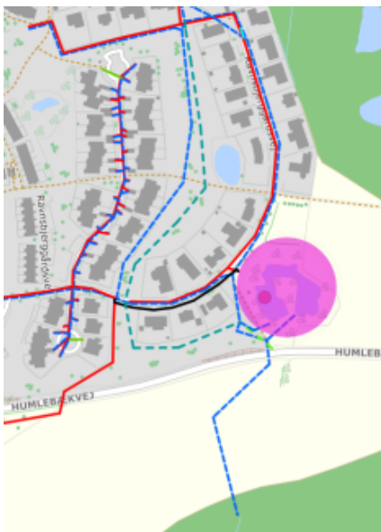
Figur 2 – Beliggenhed af eksisterende bassin med udløb til grøftesystem i Knurrenborg Vang.

Klimatilpasningsprojektet blev gentænkt og i marts 2021 forelå et nyt dispositionsforslag for klimatilpasning af oplandet. I projektbeskrivelsen fremgår det, at den øgede kapacitet skal findes ved at udskifte eksisterende Ø200 ledninger (20 cm) med større Ø800 (80 cm) ledninger. I stedet for at etablere et nyt bassin, vil man fortsat benytte det eksisterende regnvandsbassin, BASFB72, beliggende SØ for Ravnsbjerggårdsvej, se figur 2.