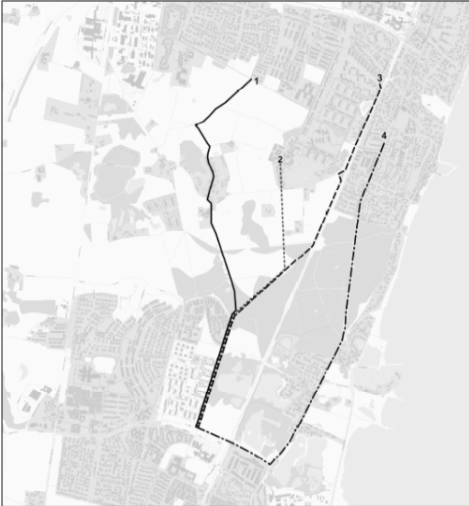
Figur 1. De fire forslag til valg af linjeføring. Rute 1, 2, 3 og 4.

Rute 1- 3 vest for Kystbanen og kobler sig alle tre til det eksisterende stisystem i Nivå ved Hovedstien mellem VIBO-boligområdet og Lergravssøerne. Dermed bliver der god sammenhæng til det eksisterende stisystem i Nivå og videre mod Kokkedal ad Banestien. Rute 4 øst for jernbanen følger hovedsageligt eksisterende stier og dermed den eksisterende sammenhæng i stisystemet. De fire løsningsforslag vil dermed alle have forbindelse til Nivå Center og Nivå station. Dog primært forslag 1-3..