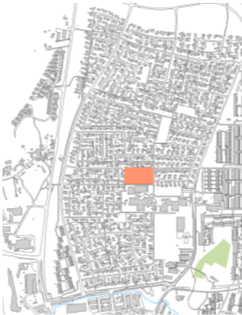
Placering af idrætsanlæg nord for Kokkedal Skole