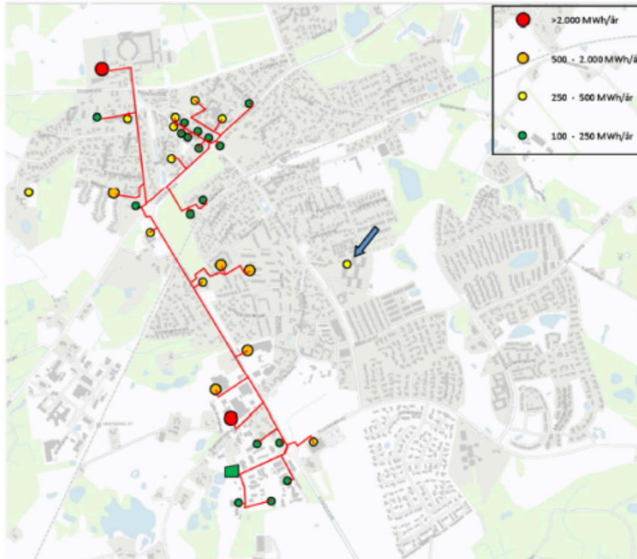
Illustration af forsyningsområdets 36 større forbrugere. Den grønne firkant i syd, markerer placeringen af varmepumpen. Pilen peger på den allerede etablerede fjernvarmeforsyning af Asminderødhave.

Projektforslaget omhandler kollektiv fjernvarmeforsyning af en del af Fredensborg, bestående af ca. 36 større forbrugere herunder bl.a. Fredensborg Slot, Ulriksdal og Fredensborg byområde. Det samlede årlige varmebehov for etape I udgør ca. 15.300 MWh. Etableringen af nettet er første skridt til at begynde at tilbyde fjernvarme i Fredensborg. Senere vil også mindre boliger langs ledningsnettet kunne tilsluttes. Der vil ikke være tilslutningspligt til fjernvarmeforsyningen.