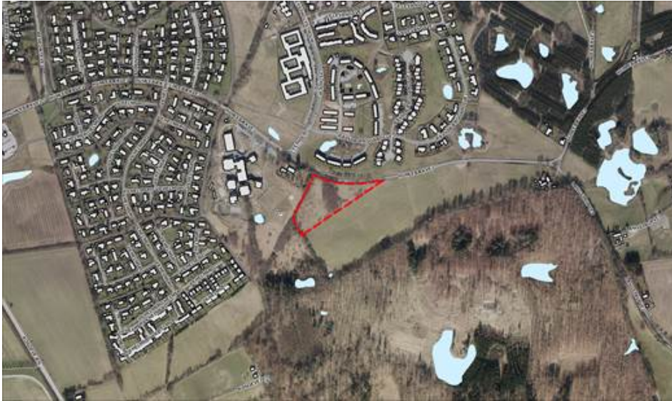
Areal som kan udskydes

Det er muligt, at udskyde et eksisterende areal, som er beliggende i byzonen og udlagt til boligformål. Arealet beliggende syd for Fredensborg Skole er et kommunalt areal, som ligger ud mod Humlebækvej. Arealet er udlagt til byzone samt boligformål i Kommuneplan 2013. Humlebækvej skaber i dag en smuk afgrænsning af Fredensborg By mod syd, og det anbefales derfor, at dette areal kan udskydes til efter 2029 til gengæld for Gunderødvej 46. Arealet er på 15.168 m 2 , hvilket modsvarer arealet på Gunderødvej 46, hvis tennisarealet fratrækkes.