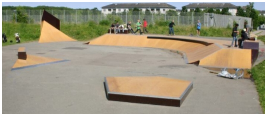
Billede af skateparken i Humlebæk kort efter opførelse i 2011

Administrationen oplyser, at der ikke er afsat midler til opbygning af en ny skaterpark.