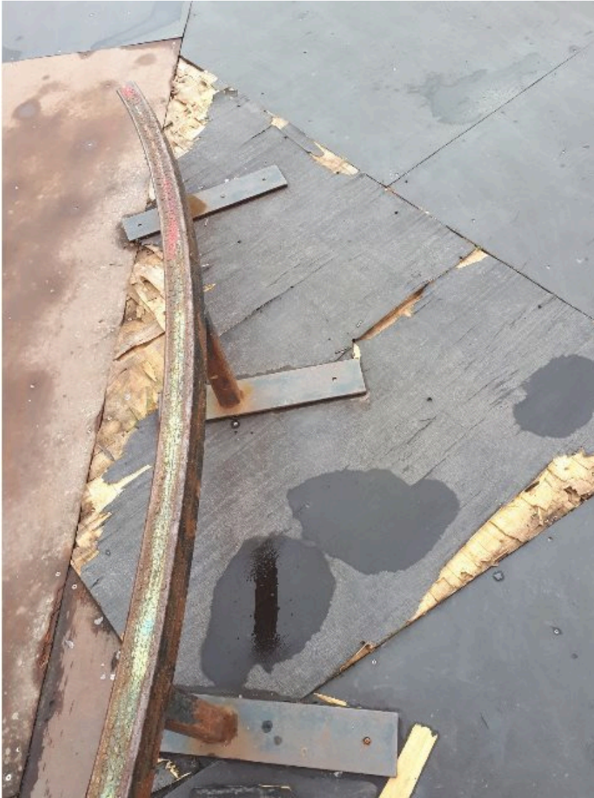
Billede af skader på Skateparken, maj 2022