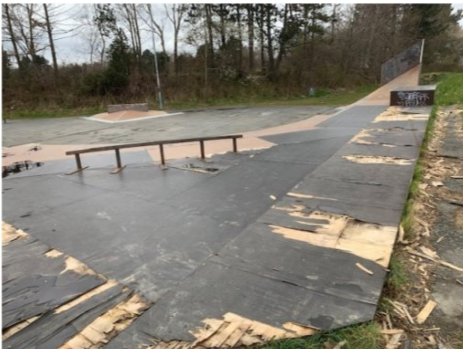
Billede af skader på Skateparken, maj 2022