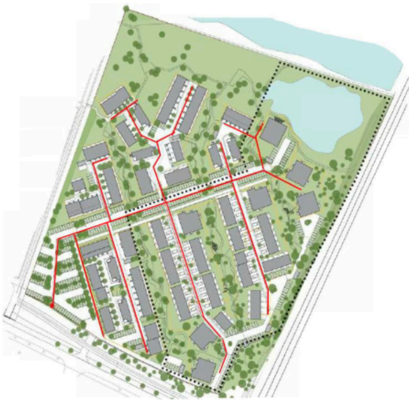
Figur 1. Forventet placering af fjernvarme- og stikledninger til Teglsøerne markeret med rød.