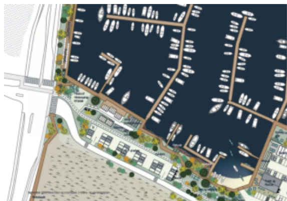
Illustration af vision for den indre promenade, Fra Visions-og udviklingsplanen, 2019

Ved Fritids-og Idrætsudvalgets vedtagelse af Visions-og udviklingsplanen blev det besluttet, at sikkerhed i havnen var blandt de elementer, der skal prioriteres højest på den korte bane (se bilag 2). Derfor lægger administrationen op til, at det besluttet, om der skal bruges projektmidler på at skabe niveaufri adgang i den indre del af promenaden via anlæggelse af supplerende træbroer og ramper. Billederne nedenfor illustrerer, hvordan den indre promenade ønskes realiseret jævnfør Visions-og udviklingsplanen: via udskiftning af eksisterende belægning og via tilføjelse af ny belægning og ramper. Dertil kommer belysning og at en del af beplantningen ryddes, så der skabes plads til anlæggelse af promenade. Dette vil komme samtlige af havnens brugere til gode, forøge sikkerhed, forskønne og skabe synlighed om udviklingsprojektet for havnen. Opgaven er estimeret til ca. 3,2 mio. kr. Processen forventes gennemført i løbet af foråret og sommeren 2021.