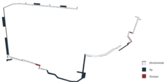
Illustration af vision om sammensætning af ny og eksisterende belægning, fra Visions-og udviklingsplanen 2019

Nedenstående tabel viser forventede udgifter i 2021 til allerede besluttede delprojekter.