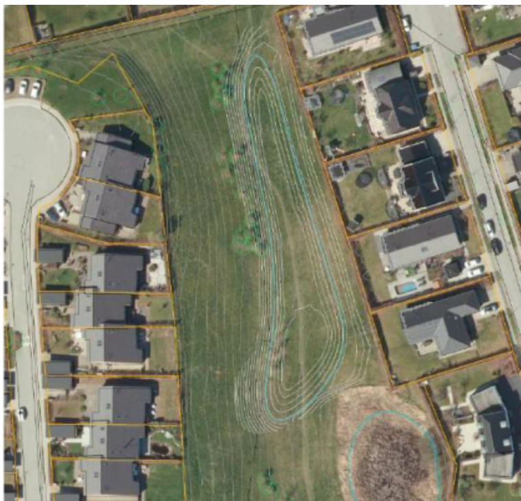
Figur 2: Placering og udformning af regnvandsbassin med luftfoto af eksisterende forhold som baggrund. Bassinet er vist med 25 cm terrænkurver, mens eksisterende terræn vises med 50 cm terrænkurver. Den blå linje i bassinet angiver den maksimale vandstand.

Vandhullet har bl.a. forekomst af spidssnudet frø, som er beskyttet iht. EU's habitatdirektiv. Projektet skal tilpasses, så det ikke forringer vandhullets natur. Der er endvidere overvejelser om at foretage en oprensning af vandhullet.