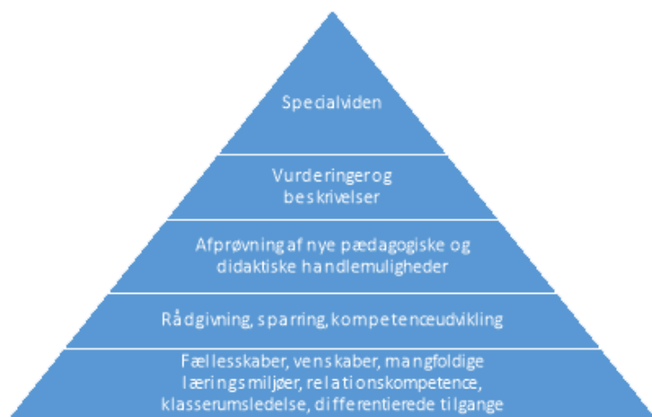
Figur 1. Opgaver og tiltag i samarbejdsgrundlaget