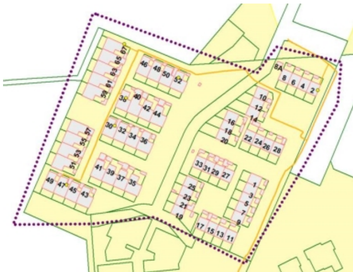
Figur 1 – Projektområdet Strandgårdsvej i Humlebæk. De gule prikker markerer de 6 husstande der er tilsluttet naturgasnettet i dag.

Projektområdet ved Strandgårdsvej i Humlebæk er i dag udlagt til naturgasområde, med individuel naturgasforsyning til hver husstand. Størstedelen af de 60 eksisterende husstande i området har valgt ikke at koble sig på gasnettet, hvilket betyder, at gasnettet i området ikke er fuldt udbygget. Der mangler i dag naturgas gadeledning til 25 husstande.