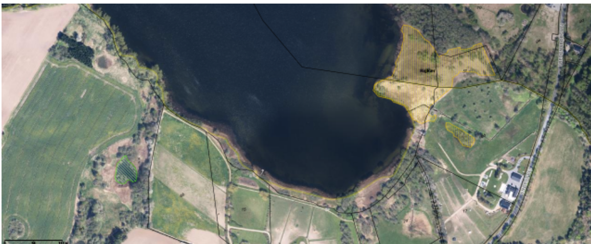
Figur 2 – Areal nord for Endrup ved kommunegrænsen til Helsingør. Rigkær er angivet med gul skravering, næringsrig sø er angivet med grøn skravering.