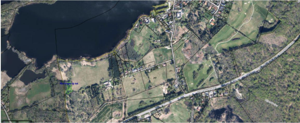
Figur 3 – Areal sydvest for Sørup ved kommunegrænsen til Hillerød. Næringsrig sø er angivet med grøn skravering.

Den konkrete plejeindsats for rigkæret drejer sig om at sikre naturtypebevarende pleje af arealet, evt. i samdrift med naboejendommene. Indsatsen gennemføres ved dialog og vejledning om de bedste plejemetoder for arealet, fx i form af ekstensiv græsning. Indsatsen er en fortsættelse af den nuværende indsats, der arbejder for den konkrete målsætning i Natura 2000-planen om, at naturtyper i tilstandsklasse III-V skal være i fremgang mod tilstandsklasse I-II.