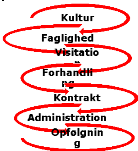
Figur 1. Styringskæde

Jf. tabel 4 forventes det, at det specialiserede voksenområde i budgetårene 2022-26 kommer ud med et budgetbehov på 4,1 mio. kr.