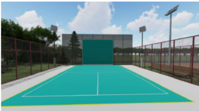
Billede 1: illustration af multibane med slåmur

Klubben ønsker multibanen placeret ved de eksisterende tennisbaner, som vist på billedet nedenfor.