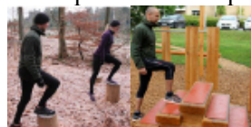
NaturFitness Træstolpe Materiale: 1100 100L: 100000 11.170,00 000 200L: 100000 11.340,00 000

Administrationen foreslår, at der opsættes motionsredskaber, der for så vidt muligt er udarbejdet i naturmaterialer, og som harmonerer med havnens og den omkringliggende naturs udtryk. Indenfor budgettet vil administrationen kunne indkøbe 4-6 redskaber som eksemplificeret nedenfor samt få bygget et plateau i træ til ophold og liggende træning inspireret af eksemplet fra Fælledparken.