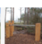
NaturFitness Stolpe Materiale: 1000 100L: 100000 11.170,00 000 200L: 100000 11.340,00 000