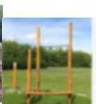
NaturFitness Træstolpe Materiale: 1000 100L: 100000 11.170,00 000 200L: 100000 11.340,00 000