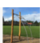
NaturFitness Stolpe Materiale: 1000 100L: 100000 11.170,00 000 200L: 100000 11.340,00 000