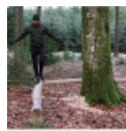
NaturFitness Balancestolpe Materiale: 2000 100L: 100000 11.170,00 000 200L: 100000 11.340,00 000