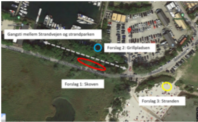
Forslag til placering af motionsplads