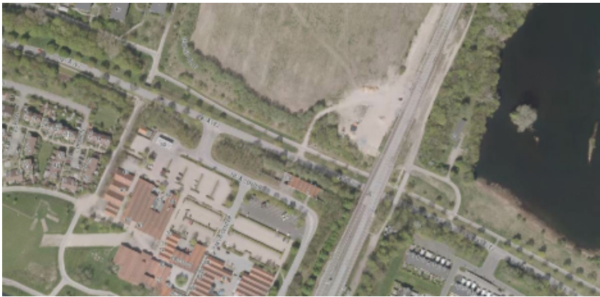
Figur: De nuværende forhold

Samtidig er Fredensborg Kommune og KFI er i samarbejde med DSB ved at planlægge for en ændring af hele Nivå bymidte og de omkringliggende kommunale arealer. Forudsætningen for udviklingen af Nivå Bymidte er, at den eksisterende adgangsvej til Nivå Centret nedlægges, og der etableres en ny adgangsvej ca. 70 meter mod øst.