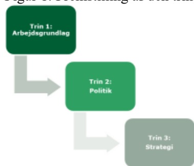
Figur 1: Fremstilling af den trinvis proces for udvikling og implementering af ny Ældre- og Værdighedspolitik

På baggrund af den nye Ældre- og Værdighedspolitik skal der udarbejdes konkrete strategier og initiativer med henblik på at implementere politikken i praksis. I figuren nedenfor ses en tydeliggørelse af den trinvis proces for udarbejdelse og implementering af den nye Ældre- og Værdighedspolitik.