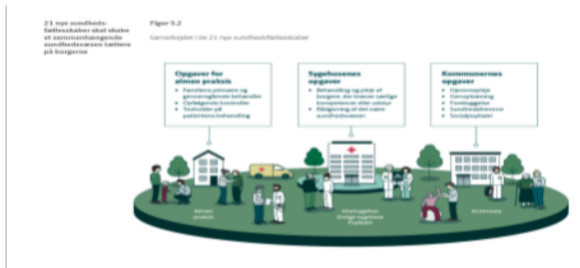
Figur 1

En central opgave for sundhedsfællesskaberne bliver at realisere målsætningen - om at en omstilling af behandlingen, der i første omgang skal aflaste hospitalerne for 500.000 ambulante behandlinger og 40.000 indlæggelser, svarende til en aktivitet for 2 mia. kr. frem mod 2025.