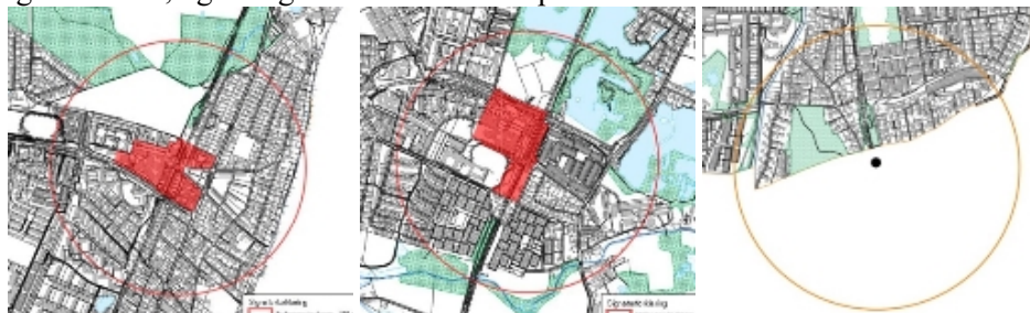
Humlebæk Nivå Kokkedal

De stationære kerneområder, omfatter alle arealer i en radius af 600 meter fra stationer på kystbanen – Humlebæk, Nivå og Kokkedal, og er afgrænset i Kommuneplan 2017.