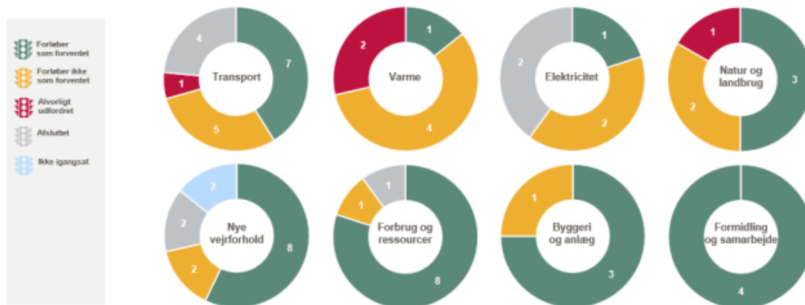
Figur 2: Status på tiltag i klimaplanen efter indsatsområde. 35 ud af i alt 67 tiltag forløber som forventet (markeret med grønt), mens 17 tiltag ikke forløber som forventet (markeret med gult), og 11 tiltag ikke er aktive, fordi de enten er afsluttede (markeret med grå) eller ikke igangsat (markeret med blå).

Der er god fremdrift i realiseringen af de fleste klimatiltag. Fire tiltag vurderes at være udfordrede. Det gælder tiltag vedrørende udbygning af grøn fjernvarme (tiltag 2.2 og 2.3), hvor planlagte fjernvarmeprojekter er forsinkede. Indsatsen for mere skov (tiltag 4.3) afventer initiativer i forbindelse med Grøn Trepert og er markeret som udfordret, da der ikke er foretaget ny skovrejsning siden sidste statusrapport. Partnerskaber til reduktion af biltrafik (tiltag 1.3) er udfordret, da regionale midler til transportprojekter bortfalder som følge af Regeringens Aftale om sundhedsreform 2024 .