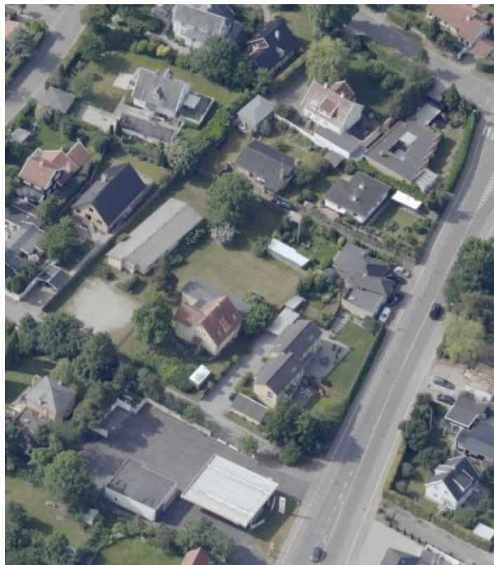
(Lokalplanområde for H113; Matrikel 3aq og 3p. Skråfoto 2020).

Lokalplanområdet er ca. 3.000 m 2 stort og beliggende på Nyvej centralt i Humlebæk. Nabobebyggelserne udgøres af huse i et, halvanden og to plan.