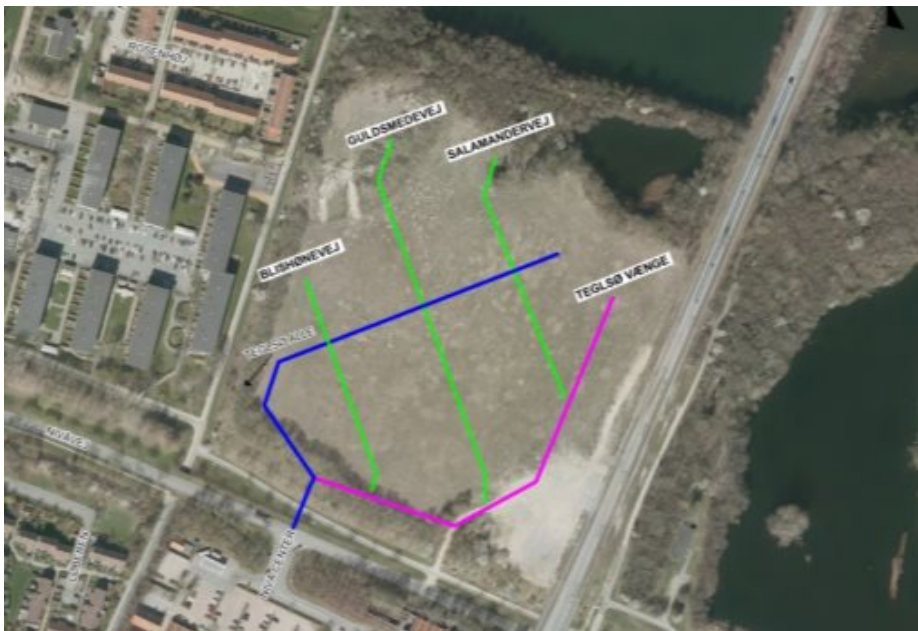
Luftfoto med vejstruktur her vist med navneforslag Forslag 1.

Området er omfattet af Lokalplan 78, der blev vedtaget i Karlebo Kommune i 2005. Bebyggelsen vil bestå af op til 300 nye boliger, der opføres som en blanding af både rækkehuse og lejligheder samt et fælleshus for hele bebyggelsen. Lokalplanområdet vejbetjenes fra Nivåvej med én overkørsel, hvilket fastholdes ved byggemodning af det nye boligområde. Fra overkørslen begynder den allerede navngivne hovedadgangsvej Teglsø Allé mod nord samt en ny fordelingsvej, der går mod syd. På tværs af hovedadgangsvejen Teglsø og den nye sydlige fordelingsvej ligger boligkoder som nord-sydgående sideveje. Selve vejprojektet er godkendt i Infrastruktur- og Trafiksikkerhedsudvalget d. 11. august 2020.