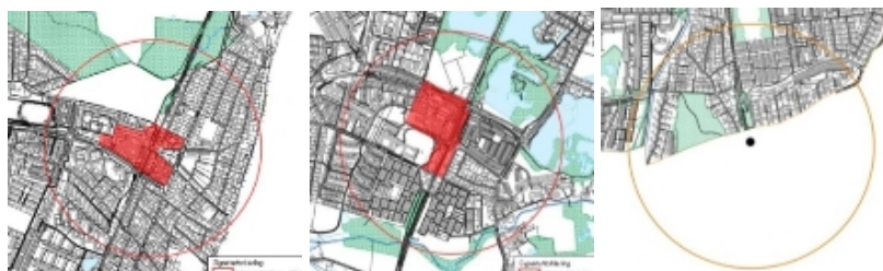
Humlebæk Nivå Kokkedal

De stationære kerneområder omfatter alle arealer i en radius af 600 meter fra stationer på kystbanen – Humlebæk, Nivå og Kokkedal og er afgrænset i Kommuneplan 2017.