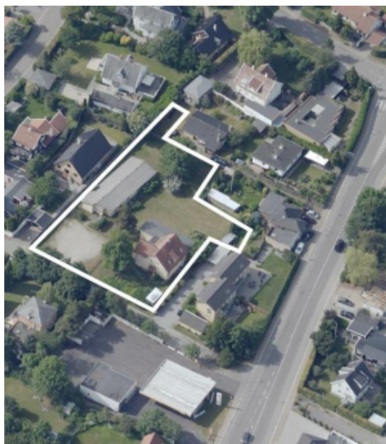
Lokalplanområde for H113

Lokalplanområdet afgrænses til Nyvej 2, 4 og 6 (matrikel 3p og 3aq) med et areal på ca. 3.000 m 2 beliggende centralt i Humlebæk. Lokalplanen muliggør opførelse af 10 nye boliger i form af tæt-lav dobbelthuse og rækkehuse i 1-2 etager. Lokalplanen muliggør en bebyggelsesprocent på 40 % for området under et.