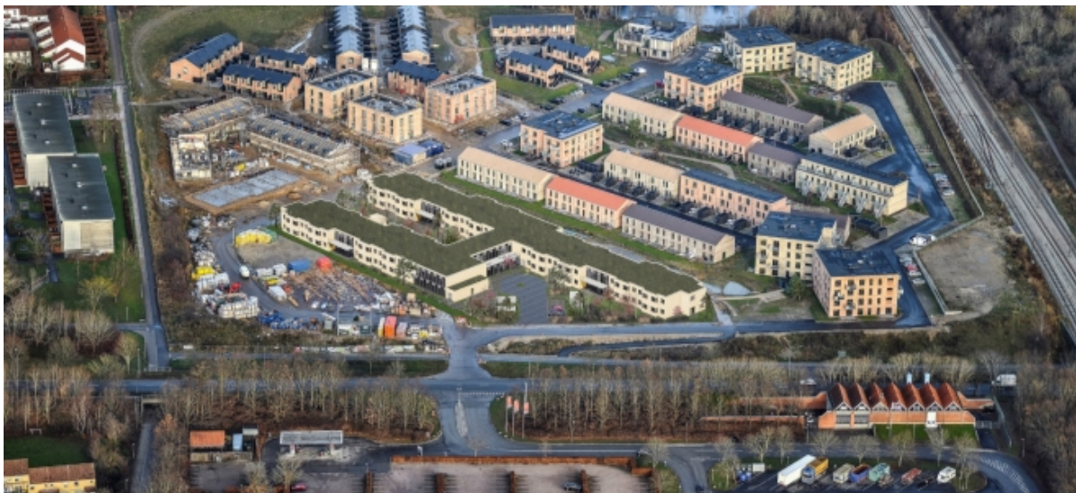
Illustration af friplejehjemmets placering i lokalplanområdet ved opførelse i 2 etager.

Bebyggelsen består af to forbundne stænger, en nordlig og en sydlig, der kan opføres i henholdsvis 2 etager og 3 etager. Lokalplanforslag N111 muliggør et etageareal på i alt 7.100 m 2 , hvor der udover dette også kan etableres altaner, overdækkede arealer og sekundære bebyggelser, herunder skure og drivhuse.