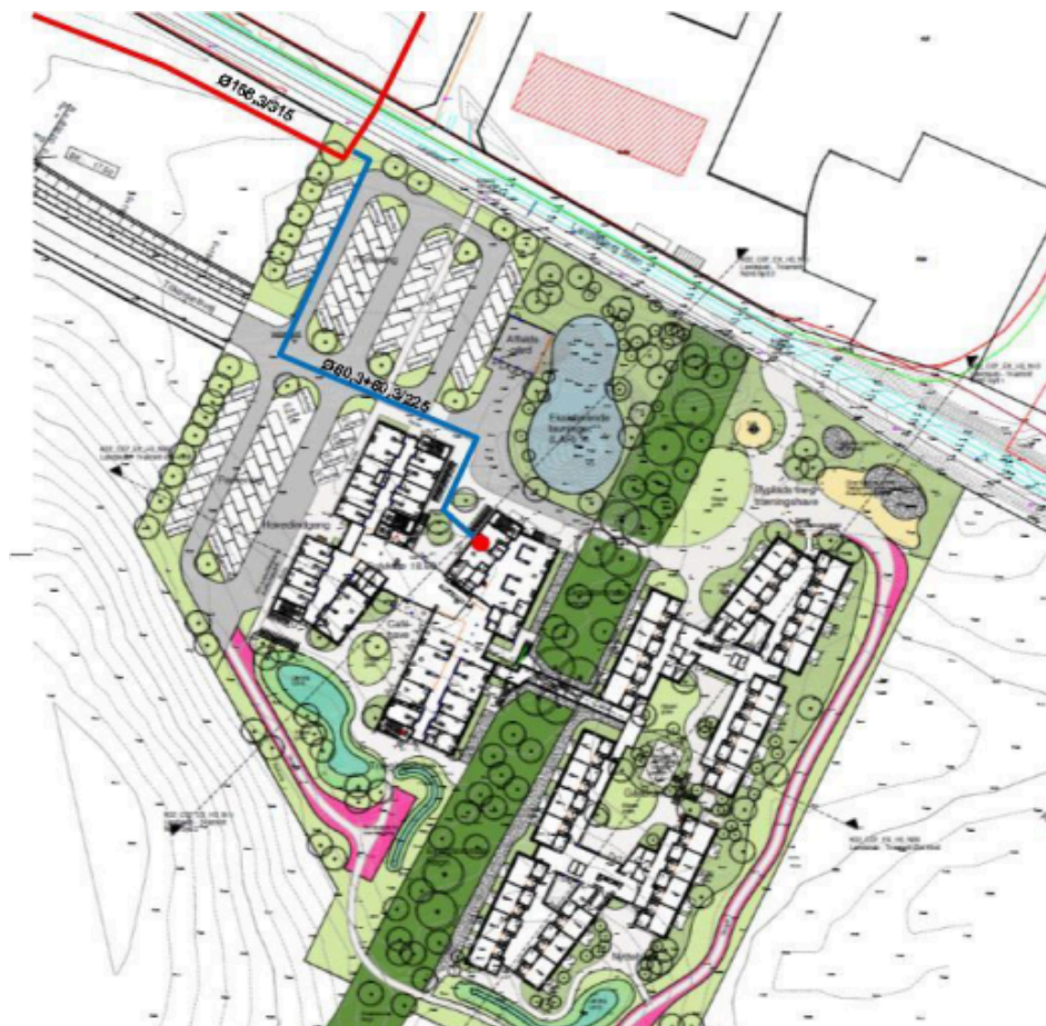
Figur 1. Forventet placering af fjernvarme og stikledning til Pleje- og rehabiliteringscenter.