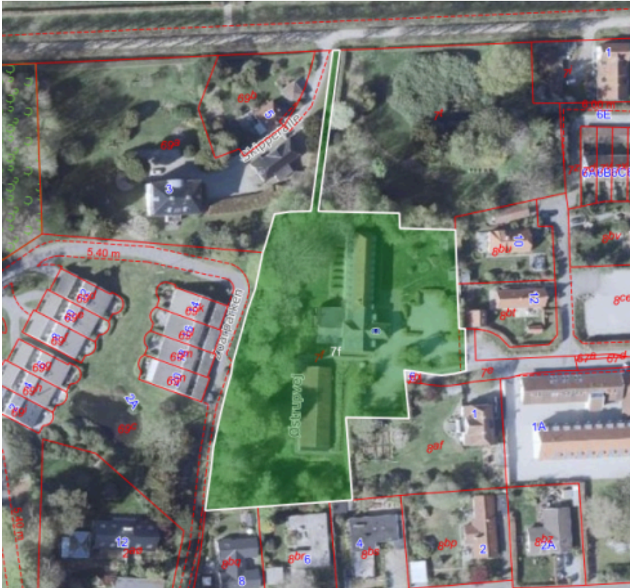
Lokalplanområdets afgrænsning (med grønt)