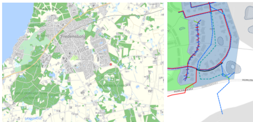
Figur 1: oversigtskort, Figur 2: oplandsafgrænsning

Tillægget beskriver omfanget af de klimatilpasningstiltag, der skal udføres i kloakopland FB72, for at Fredensborg Forsynings regnvandssystem lever op til serviceniveau. Det beskrives, hvilke matrikler og grundejere, der berøres af kloakarbejdet, samt af bassinudvidelsen. Med plantillægget bliver bassinet dimensioneret til at håndtere en 5 års regnhændelse som den ser ud om 50 år.