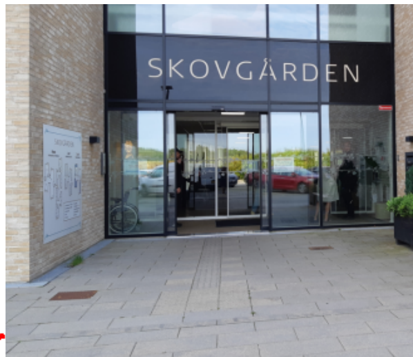
Skovgården – gammel placering og anvisning af ny.