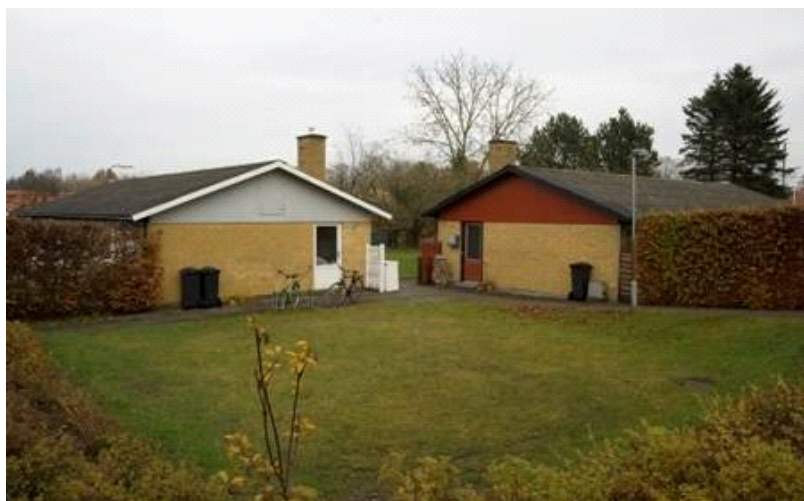
Toftegårdsvænge B består af 32 enfamiliehuse hver på 112 m 2 og opført i 1969

Da der således forelå et projekt for hvordan og en tidsplan for hvornår boligerne ville være bragt i en sundhedsmæssig forsvarlig stand, besluttede Økonomiudvalget den 16. juni 2014 efter indhentelse af udtalelse fra embedslægen at udsætte kondemneringsfristen indtil renoveringen er afsluttet, hvilket på daværende tidspunkt blev vurderet til august 2015. Siden er tidsplanen blevet forsinket et par måneder.