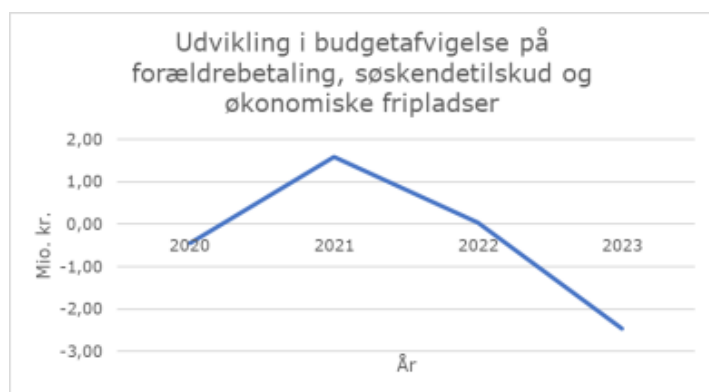
Figur 1. Udviklingen i budgetafvigelse i perioden 2020 til 2023

Note: Minus angiver merforbrug/mindreindtægt.