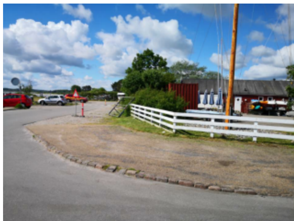
Administrationens forslag til placering af madvogn

Der vil i forbindelse med madvognen blive behov for tilslutning til strøm, som ansøger selv betaler og evt. afhentning af affald mod betaling til Nivå Havn. Ansøgeren har baggrund i restaurationsbranchen og er samtidigt en lokal Nivå borger, som ønsker at levere kvalitetsbevidst fastfood til sit lokalsamfund.