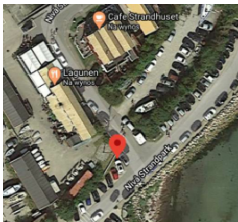
Administrationens forslag til placering af madvogn.

Administrationen har modtaget en ansøgning om at opstille en madvogn i perioden fra april til september 2021. Der har tidligere været dialog mellem administrationen og ansøger, hvor der ikke er fundet en endelig placering, men hvor der umiddelbart peges på placeringen herunder. Da vejarealet ikke er et offentligt vejareal, administreres arealet af Nivå Havn, hvorfor driftsbestyrelsen bør komme med en anbefaling, før beslutningen træffes endeligt i Fritids-og idrætsudvalget.