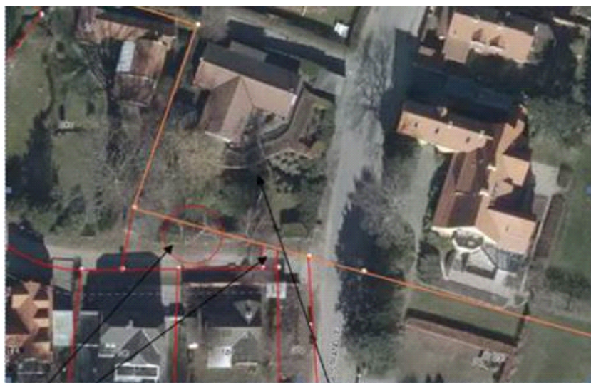
1 ax og 27 I Krogerup, Humlebæk (Fredensborg) 2 bm Tibberup By, Egebæksvang (Helsingør)

Det skal fremhæves, at kommunen ikke ejer nogen af de involverede ejendomme. To af dem er blot beliggende i Fredensborg Kommune.