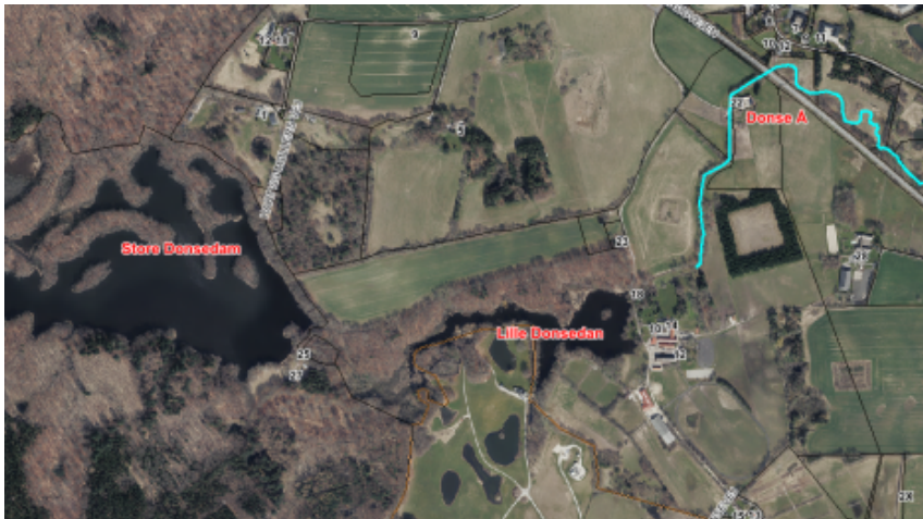
Figur 2 Projektområde sikring af sommervandføring

I tilbuddet går løsningen ud på at udnytte magasinkapaciteten i Store Donsedam. Denne løsning er tidligere undersøgt i 2014. Det tidligere løsningsforslag spærrede dog for vandløbsdyrenes passage og var derfor ikke optimal for biodiversiteten. Den nye løsning går på at opdele afløbet fra Store Donsedam i 2-3 forskellige afløb og tilhørende vandløbsstrækninger, der hen over året lukkes/åbnes for at magasinere vandet henover vinteren og aflede det langsomt henover sommeren.