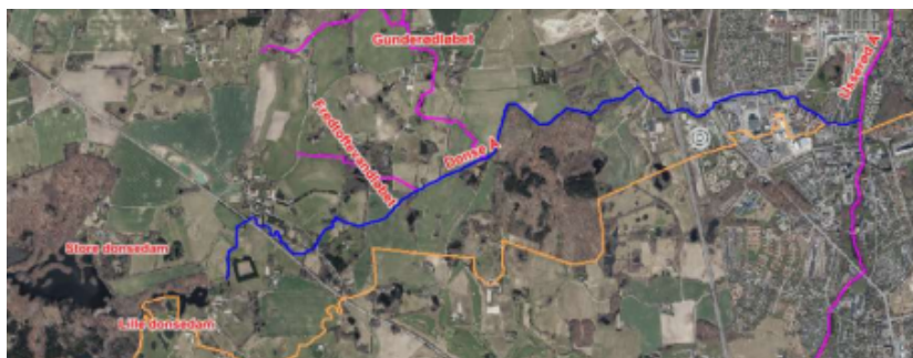
Figur 1 Oversigtskort. Blå streg er Donse Å

Donse Å er et vandløb på 6,1 km, der har udløb i Donsedammene nord for Tokkekøb Hegn og som udløber i Usserød Å i Kokkedal.