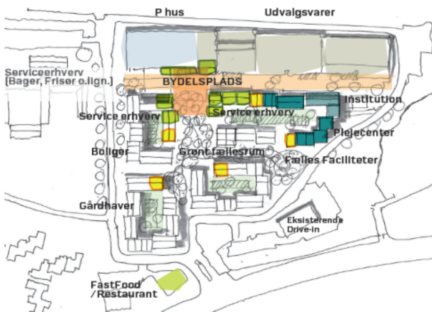
Idéskitse af det reviderede projektforslag.

For at medvirke til en fredeligholdelse af det ønskede boligområde for kørende trafik foreslås den primære adgangsvej, i den gældende lokalplan, flyttet til en placering langs kommunegrænsen. Denne suppleres med en sekundær adgangsvej langs ådalen, hvor særligt varetrafik kan få adgang til butikkerne fra. Parkeringspladserne til boligerne placeres hovedsageligt i et p-hus i randbebyggelsen mod motorvejen.