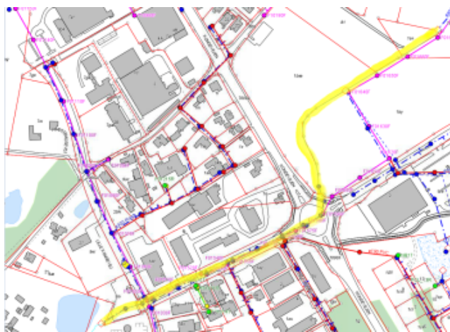
Figur 1 Strækning af Grønholtåens sideløb, der foreslås optaget som spildevandsteknisk anlæg i Spildevandsplan 2021

Vandløbet er ikke målsat i Vandplanerne og er ikke registreret som § 3 natur. Dog ønsker kommunen, at vandløbet fortsat holdes åbent i harmoni med kommunens politik om mere biodiversitet. Forsyningen har tilkendegivet, at de ikke har intention om at ændre på de eksisterende forhold, idet de i forvejen arbejder for øget biodiversitet på deres arealer.