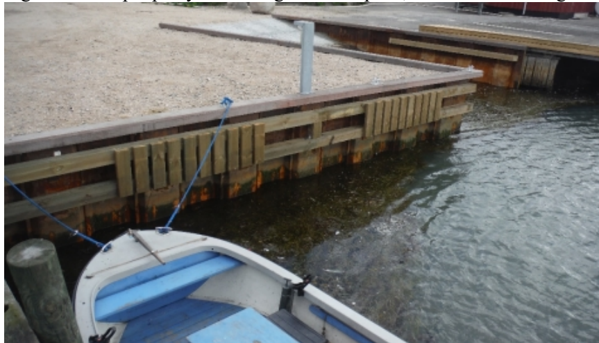
Figur 3 Eksempel på ny indfatning med stålspuns, hammer i azobé og afvisertræ i fyretræ

På nedenstående foto (figur 3) ses renovering ved stålspuns, som anbefales for Riggerkajen. Eksemplet er fra Dybvig havn.