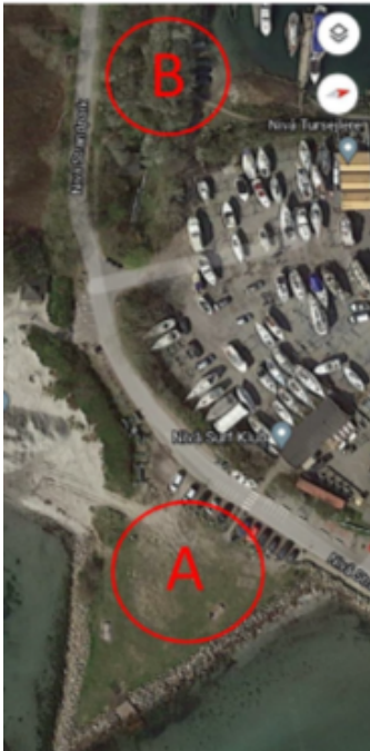
Billede af forlag til to placeringer af madvognen i Nivå Havn. Placering A ved trekanten. Placering B ved ”skoven”.

Ansøgerne foreslår to placeringer af madvognen ved A eller B (se billede på næste side). Placering A er et areal, der er omfattet af reglerne om strandbeskyttelse, og der kan derfor ikke placeres en madvogn uden en dispensation fra Fredningsnævnet. Derudover har surferne aktiviteter ved placering A. Placering B i ”skoven” er et grønt areal med gang- og cykelsti, der fører fra Strandvejen til havnen. Administrationen vurderer, at en madvogn kan være med til at skabe liv i et ellers stille område af havnen. Placering B vurderes derfor som mest hensigtsmæssig.